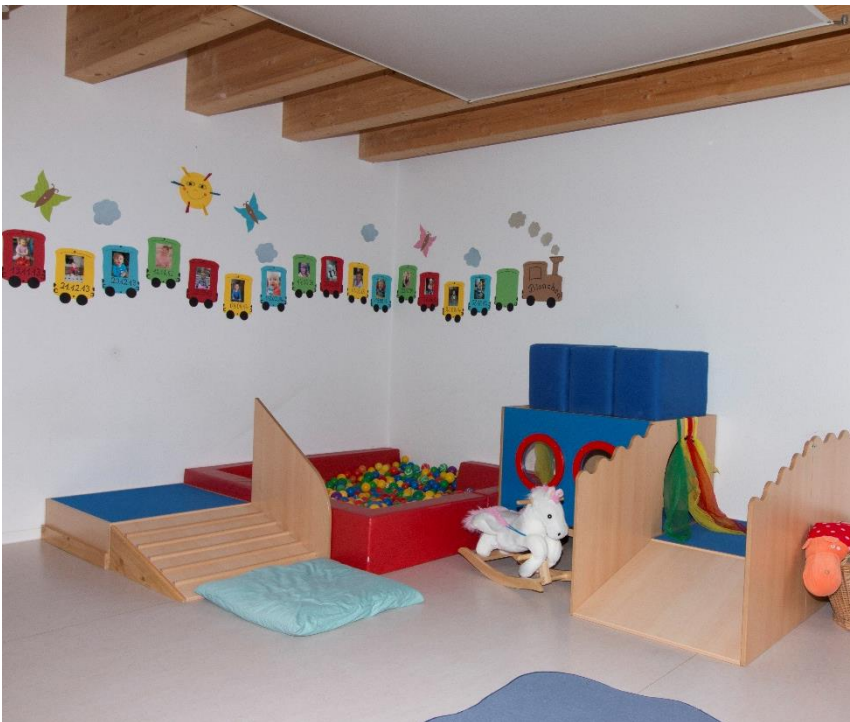
Gruppenraum 2 (Bienchen)

ist ausgestattet mit einem Bälle-Bad und einer Mattenlandschaft mit Bewegungspodesten. Auf der „Insel der Krabber“ haben die Kinder die Möglichkeit, ihr Bewegungsprofil zu entwickeln und zu fördern. Eine Kochküche lädt zu ersten Rollenspielen ein.